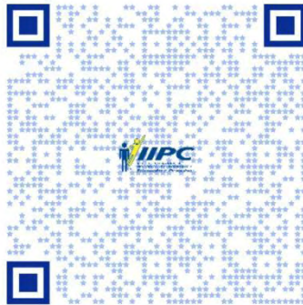
QRCode para acessar os vídeos do projeto.

5. Vídeos. Aspecto também inovador do grupo foram os vídeos de chamada gravados para divulgar os eventos, realizados em clima leve e descontraído, fora da caixinha , o que acabou por se tornar a marca do grupo.