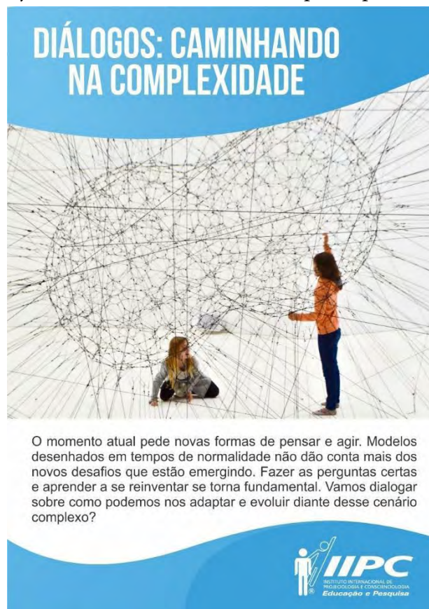
Arte de chamada para o evento Diálogos: Caminhando na Complexidade .

Diálogos. Após a atuação no 12º EV, foi realizado o evento Diálogos: Caminhando na Complexidade , no dia 19 de julho de 2020. Foi atividade on-line , com parte expositiva e interativa, tendo o objetivo de apresentar as etapas do projeto e convidar os voluntários a participarem dos workshops .