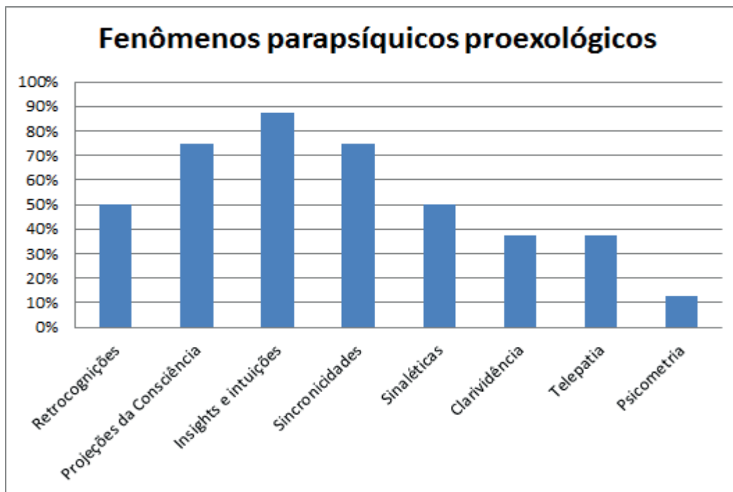
Figura 2. Porcentagem de membros do grupo que vivenciaram fenômenos projeciológicos associados à programação existencial.